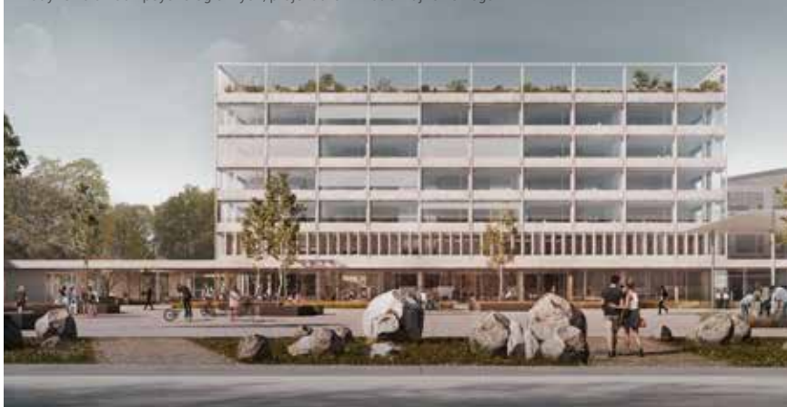
Budynek dla nauk psychologicznych, projekt arch. Piotra Bujnowskiego.