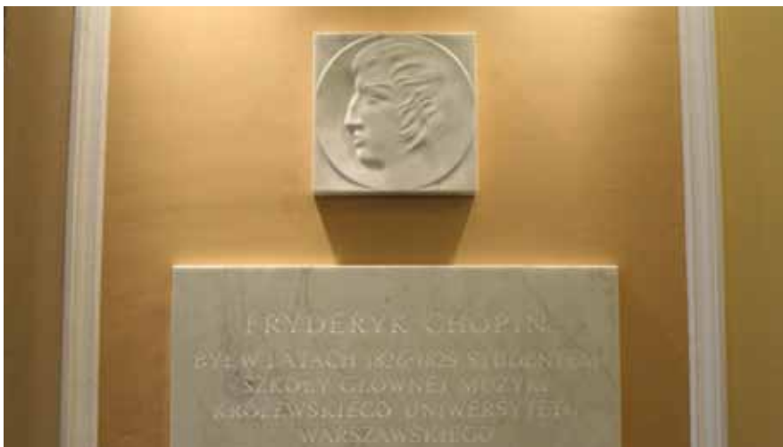
Tablica upamiętniająca związki Fryderyka Chopina z UW