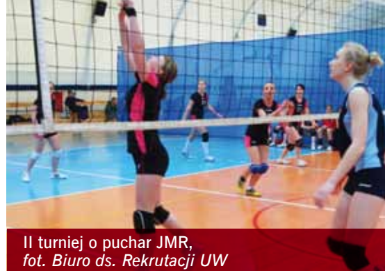
II turniej o puchar JMR, fot. Biuro ds. Rekrutacji UW