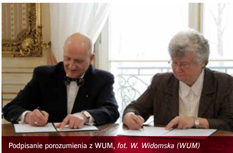
Podpisanie porozumienia z WUM

CePT jest jedynie jednym z wielu przykładów naszej wieloletniej współpracy – podkreślał rektor WUM, nawiązując m.in. do planów uruchomienia przez obie uczelnie wspólnego kierunku studiów „Logopedia ogólna i kliniczna”. Od kilku lat UW i WUM prowadzą też prace nad stworzeniem Ośrodka Produkcji Radiofarmaceutyków, który mieścić się będzie w Środowiskowym Laboratorium Ciężkich Jonów UW. Ośrodek będzie jednostką badawczą oraz producentem radiofarmaceutyków stosowanych w pozytonowej tomografii emisyjnej, która pozwala na diagnozowanie i ocenę stanów nowotworowych oraz bezinwazyjną diagnostykę kardiologiczną.