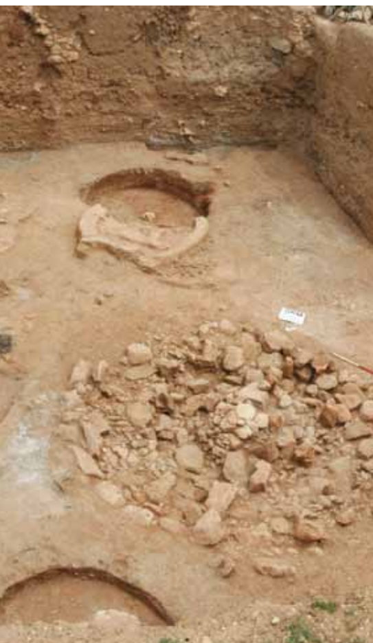
Jedna z wież w Tell Qaramel

Badana przez polskich archeologów od 1999 r. osada zajmuje 4,5 ha. Jej mieszkańcy mieli rozwiniętą kulturę materialną i architekturę. Archeolodzy natrafili na liczne fundamenty okrągłych domostw, świątyń, odnaleźli też mury obronne oraz 8-metrową wieżę, która powstała około 8350 r. p.n.e. W trakcie wykopaliisk odnaleziono też liczne kamienne przedmioty – narzędzia, przybory