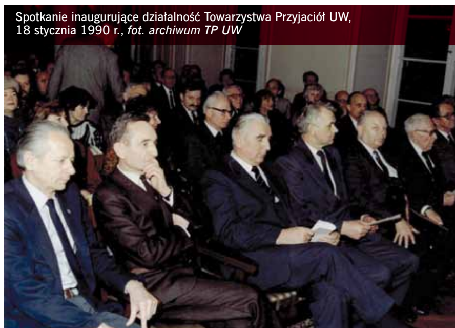
Spotkanie inauguracyjne działalności Towarzystwa Przyjaciół UW, 18 stycznia 1990 r., fot. archiwum TP UW

Już w czasie swej pierwszej kadencji towarzystwo zainicjowało, odbywający się cyklicznie do tej pory, konkurs na najlepsze