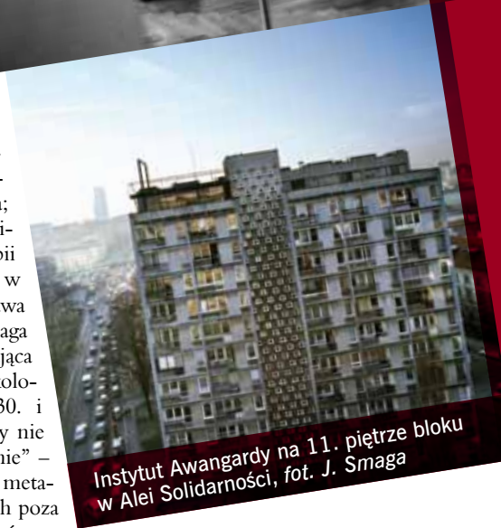
Instytut Awangardy na 11. piętrze bloku w Alei Solidarności